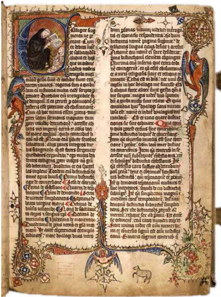
MS. 27, 2. Drittel 14. Jhd., Pergament, 235 Blätter

Sammlung von Wundergeschichten, die eine wertvolle Quelle für die mittelalterliche Kulturgeschichte bilden.