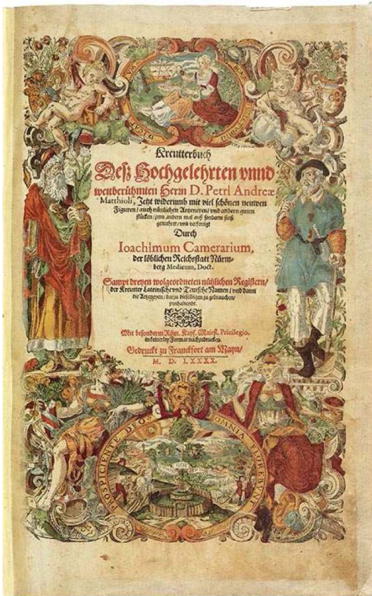
Kräuterbuch des Matthioli, 1590

Die Universitäts- und Landesbibliothek besitzt eine große Sammlung wunderschöner Pflanzenbücher und rund 1.000 Inkunabeln. Ob sie zu den wertvollsten ihres Genres gehören, haben wir noch nicht abschließend erforscht.