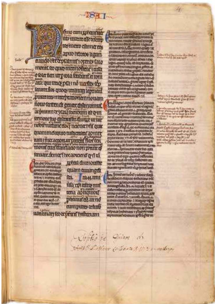
Prolog des Kirchenvaters Hieronymus zum nachfolgenden Jesajabuch mit zahlreichen Glossen, um 1240/50

In die Anfertigung umfangreicher Handschriften flossen nicht nur viele Monate oder Jahre eines Schreiberlebens, die Handschriften sind darüber hinaus durch und durch Natur, d.h. man kann mit Fug und Recht sagen, sie entwickeln sich weiter, sie leben. Allein schon deshalb, weil sie aus Teilen von Lebewesen gemacht sind: aus den Häuten von Schafen, togeborenen Kälbern, Ziegen oder Hirschen. Holzbrettchen wurden für die Buchdeckel verwandt, in der Hand des Scriptor lagen Gänsefedern oder geschnittenes Schilfrohr, in der des Miniators Pinsel aus Marderhaar. Zerstoßener Gallapfel oder Knochenasche machten die Tinte schwarz, während Schnecken, Insekten und Pflanzenzubereitungen die Pigmente für die Malereien lieferten. Darüber hinaus leben Handschriften – wie gedruckte Bücher auch – dadurch, dass ihre Leser oder Besitzer sich in ihnen verewigen durch das Einbringen von Ex Libris, durch Anstreichungen, Kommentare und viele andere Zeichen mehr.