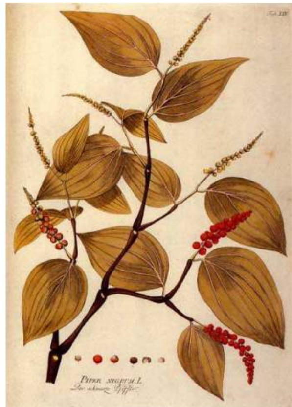
Icones Plantarum, Tafeln, aus der Sammlung Vester