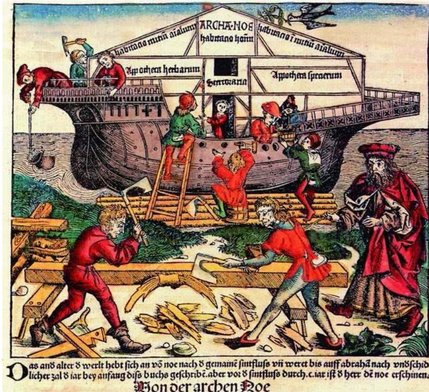
Hartmann Schedel, Das Buch der Geschichten , 1493

handschriftlich durch den Rubrikator ergänzt und erst im letzten Viertel des 15. Jahrhunderts eingedruckt. Bücher aus dieser Zeit bezeichnet man als Inkunabeln, Wiegendrucke; es handelt sich um Bücher aus der Zeit, wo die Druckkunst noch „in den Windeln“ lag. Für uns ist das ein großes Glück, weil wir auf diese Weise über einen umfangreichen Schatz an individuell gestalteten Büchern verfügen, die mit den heutigen normierten Drucken in keinsten Weise vergleichbar sind. Sie wurden übrigens vor ihrem Verkauf nicht gebunden. Die in Fässern transportierten Bogen wurden erst vom Käufer nach eigenem Geschmack mit individuellen Einbänden versehen und ggf. zusätzlich ausgemalt. Unter diesen Frühdrucken befinden sich viele Chroniken, von denen die Weltchronik des Hartmann Schedel (1493) zu den verbreitetsten gehörte.